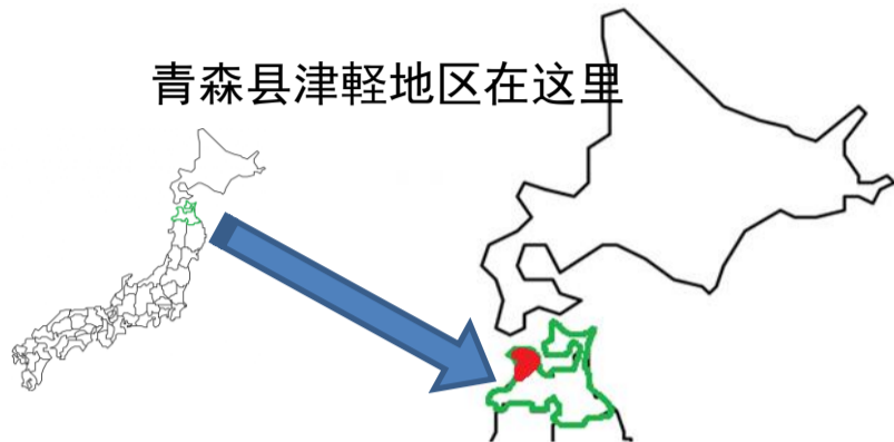
青森县津轻地区在这里