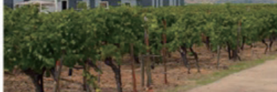
世界50か国にのぼる輸出