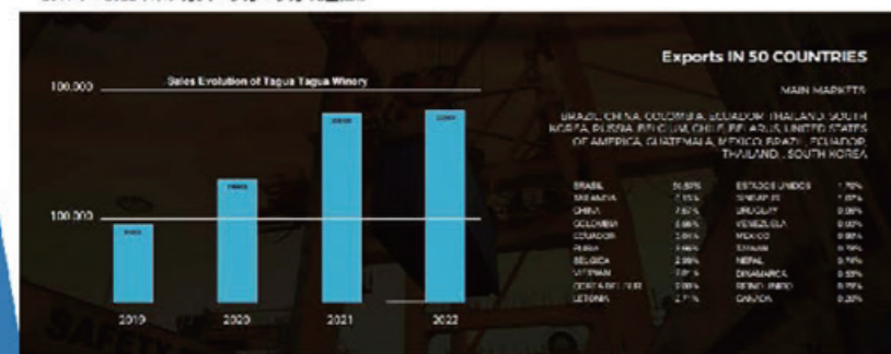
2019年～2022年ボデガス・タガ・タガ 売上推移