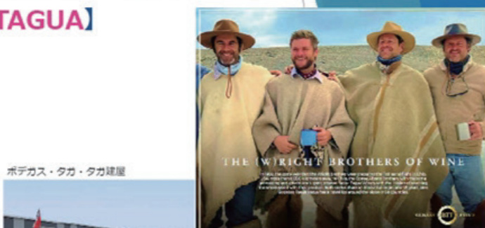
ボデガス・タガ・タガ建屋

ブラジルを始め南米や中国、タイなどのアジア諸国でも人気を博す世界で人気急上昇中の実力派ワイナリーが、2024年に日本初上陸！日本市場でも、瞬く間にリピート多数の人気商品となっています！